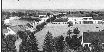
Piața Centrală, inc. sec. XX

lea, Cevzen), Macedonia (1332 - 1337), Obad (1401, Ohad) și Petroman (1333 - Petrus, Petree);