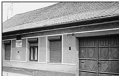
Casa în care s-a născut Dositej Obradovici

La Timișoara, liceul de limbă sârbă care adună elevi din aproape tot Banatul a primit, spre cinstirea luminatului cărturar, numele de „Liceul Dositej Obradovici”, funcționând în